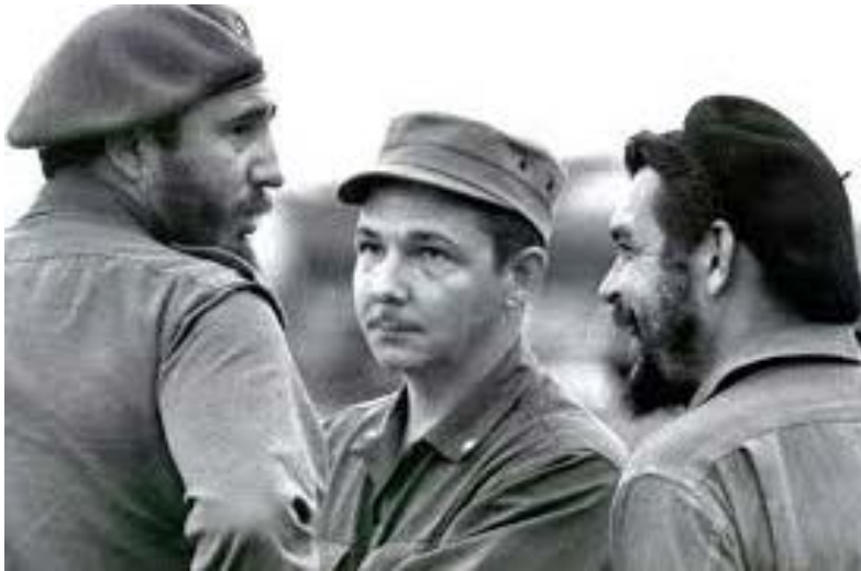
Fidel Castro, Raúl Castro, and Che Guevara, early days of the revolution

Raúl Castro Ruz cumplirá 95 años el 3 de junio. Durante 73 años ha cometido atroces crímenes contra los cubanos y los ha privado de sus derechos fundamentales —civiles, políticos, económicos, sociales y culturales, comenzando por el de la autodeterminación.