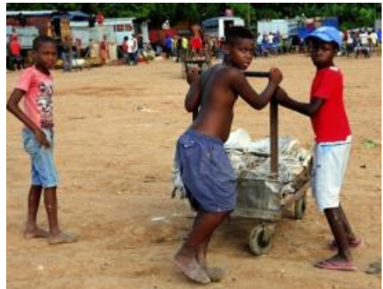
Niños vendiendo sacos en un mercado de La Habana.

Se sabe que las autoridades cubanas nunca hubieran autorizado una visita realmente independiente orientada a la determinación de los hechos. Los extranjeros de cierto perfil que visitan Cuba sólo pueden realizar giras como ésta, cuidadosamente coreografiadas, cortesía del enorme aparato de espionaje y propaganda del régimen que cuenta con una larga experiencia en esto. Pero, varias